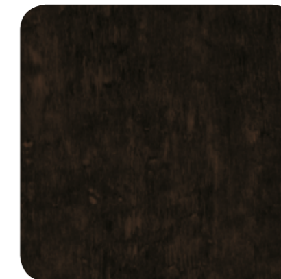
Café Brown – D 8120 MR