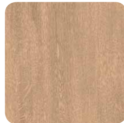
Pale Oak – D 1121 MR