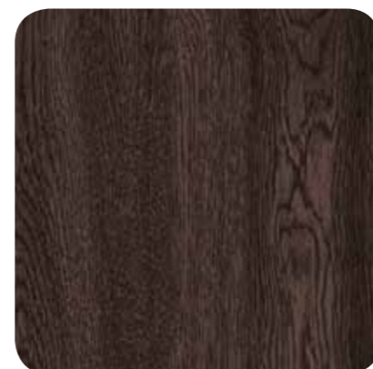
Dark Oak – D 8116 MR