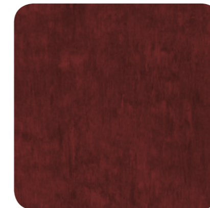
Aneho Brown – D 8119 MR