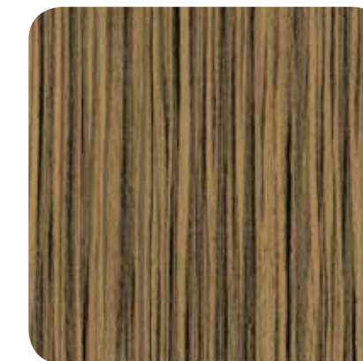
Zebrano Natural – D 8121 MR