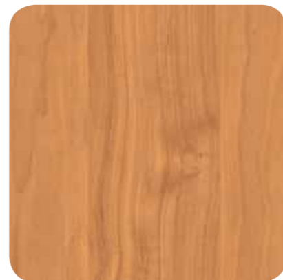
Sunny Pear – D 1113 MR