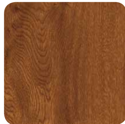
Golden Oak – D 8109 MR