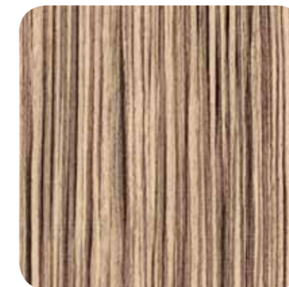
Zebra – D 1117 MR