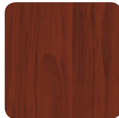
Colonial Red – D 8104 MR