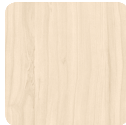
Nordic White – D 1115 MR