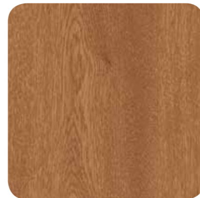
Scottish Oak – D 8115 MR