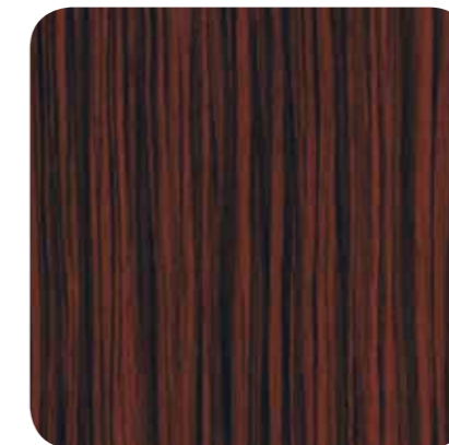
Okene Line – D 8122 MR