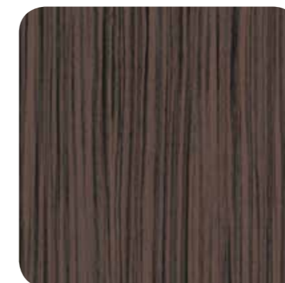
Dark Zebrano – D 8123 MR