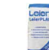
LeierPLAN vékony falazóhabarcs