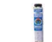
LeierFIX univerzális építési ragasztó